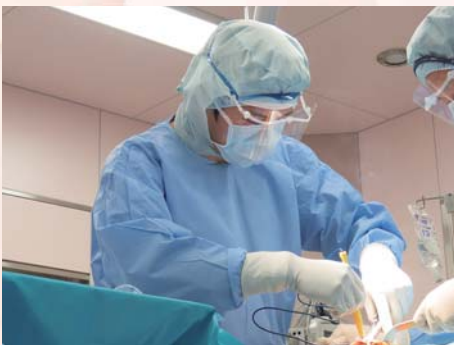
日本整形外科学会専門医、日本リウマチ学会指導医 日本人工関節学会認定医、日本医師会産業医 日本骨粗鬆症学会認定医

高齢化に伴い股関節や膝の痛みに悩む患者さんは増加傾向にありますが、医療技術の進歩に伴い、安全で痛みの少ない治療法が開発されてきています。最先端の技術により、少しでも多くの方が辛い痛みから解放され、からだを動かす喜びを再び感じていただけるようお手伝いしてまいります。