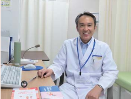
内分泌代謝内科指導医、糖尿病専門医 総合内科専門医

日常生活における身体活動量の低下や運動不足は、血糖値が高いことよりも関連死亡者数が多いと言われています。最近の研究結果でも示されているように、「今よりも10分多く、元気にからだを動かす」ことで、生活習慣病の発症を低下させるだけでなく、日常生活を制限されず健康に生活できる期間である「健康寿命」をのばすことができる可能性があります。厚生労働省が提唱・啓発している「運動によって健康増進を実現」するためのガイドラインをふまえて、糖尿病でない方はその発症を、糖尿病の方は合併症の進展を抑えるために必要なこととお話しできればと思います。